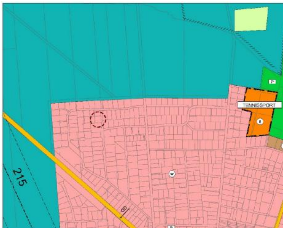
Abb.1: Ausschnitt aus dem Flächennutzungsplan, Stand November 2020, (ohne Maßstab)

Der wirksame Flächennutzungsplan der Stadt Celle stellt das Plangebiet als „Wohnbauflächen“ dar. Die Änderung des Bebauungsplanes wird gem. § 8 Abs.2 BauGB aus dem Flächennutzungsplan entwickelt.