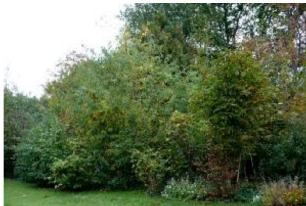
Abb.2: Grundstück östliche Straßenseite, 14.10.2020 Abb.3: Rückseite (westlich)