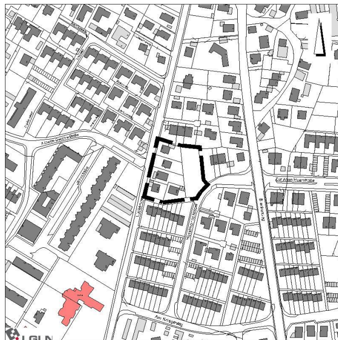
Nr.10 Ace 4.Ä. „Bleckenweg“