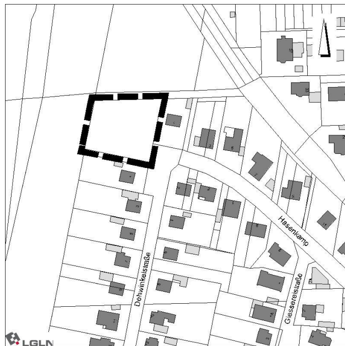
Nr. 35 Wce 1.Ä. „Gießereistraße“ der Stadt Celle