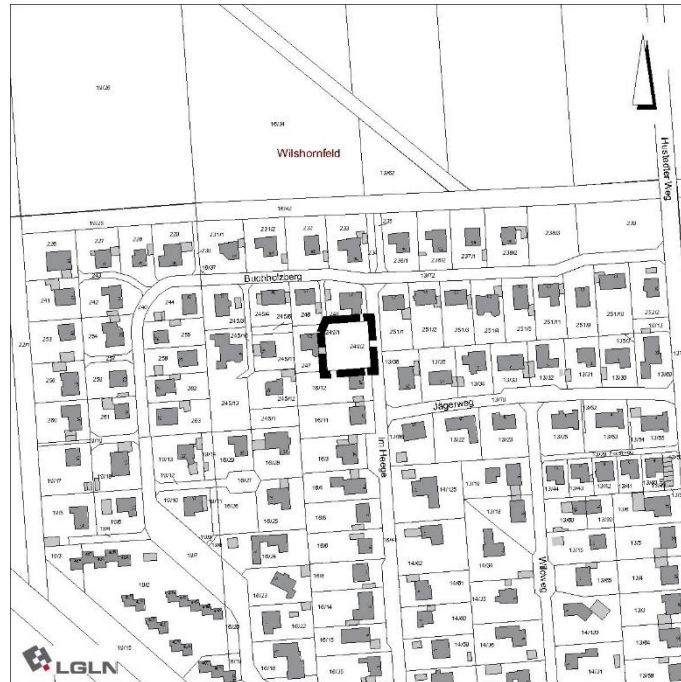
Bebauungspläne Nr.8 GrH 1.Ä. „Wilshornfeld“